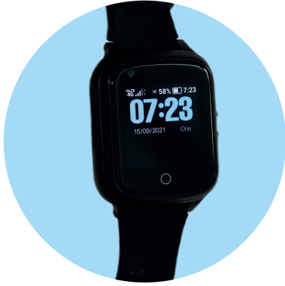
1. Smartklockan Bo